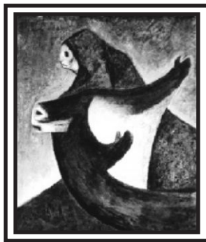
RENÉ VILLANUEVA Homenaje a Frantz Fanon

llegado la construcción de una Otra Política en México. Una otra política sin Estados rectores, sin Dirección Nacional que ordene, sin Partidos guías, sin Rayitos de Esperanza, sin Generales ni Patrones. Porque ya no queremos que alguien nos mande, nuestra Rabia tiene como insumo su insolencia y su cinismo. Una otra política que se sintetiza en la séptima llave leída en el Zócalo en 2001 por los compañeros del EZLN, cuando dijeron un estruendoso: Ustedes, la séptima y más importante llave son ustedes, nos dijeron. Sí, Nosotros. Los invisibles, los insumisos, los comunes y corrientes, los de abajo, los que no somos nada ni Nadie, los que no entramos a las Mesas de los grandes analistas de derecha ni de izquierda, porque no entendemos los grandes temas nacionales. Los que sabemos que, más abajo que abajo, algo se está produciendo, algo está en construcción, algo se prepara. Y entonces las palabras sobran, los discursos son vanos, las arengas son fatuas. Una mirada, un guiño de ojo, una sonrisa, un gesto, un beso, nos dicen más. Nos dicen que, si bien, falta lo que falta, cada vez falta menos.